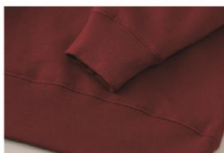
ハードな使用にも耐えうる 2本針縫製